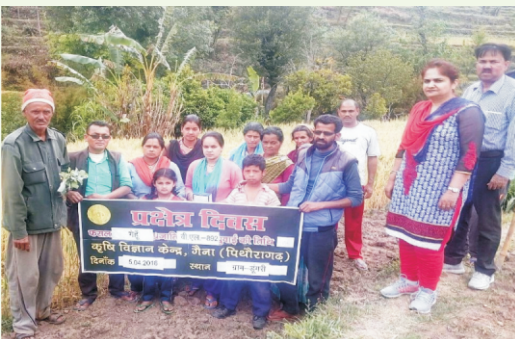
प्रक्षेत्र भ्रमण का आयोजन