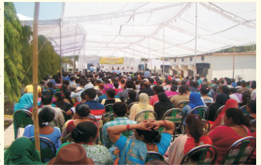
प्रधानमंत्री फसल बीमा योजना पर जागरूकता कार्यक्रम का आयोजन

इंश्योरेन्स कम्पनी ऑफ इंडिया लिमिटेड, देहरादून के क्षेत्रीय प्रबन्धक एवं अन्य रेखीय विभागों के अधिकारियों द्वारा प्रतिभाग किया गया। इस