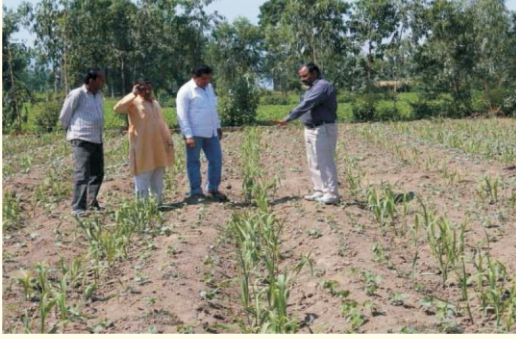
टीएसपीओ परियोजना के अन्तर्गत प्रदर्शन

इसी प्रकार परियोजना के अन्तर्गत प्याज की एग्री फाउण्ड लाईट रेड प्रजाति के 30 प्रदर्शनों का आयोजन 1.2 है. क्षेत्रफल में किया गया। टमाटर में हिमसोना हाईब्रिड के 30 प्रदर्शनों का आयोजन 2.0 है. क्षेत्रफल में किया जा रहा है। परियोजना के अन्तर्गत इन सभी प्रदर्शनों का आयोजन चकराता विकास खण्ड के हटाल एवं सैन्य तथा कालसी विकास खण्ड के उत्पाल्टा जनजातीय गांवों में किया गया।