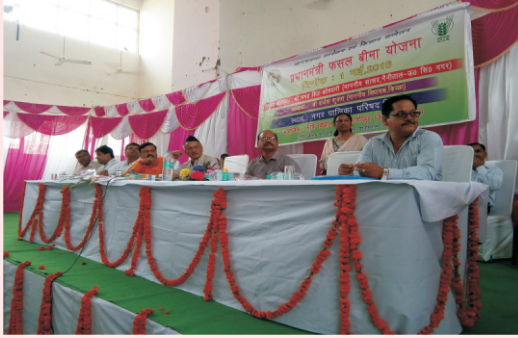
गोष्ठी के आयोजन अवसर पर मंचासीन मा. सांसद भगत सिंह कोश्यारी