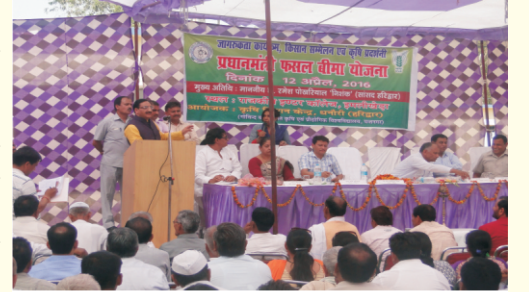
उद्घाटन अवसर पर कृषकों को सम्बोधित करते हुए मा. सांसद हरिद्वार डा. रमेश पोखरियाल निशंक