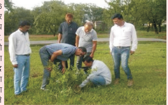
केन्द्र भ्रमण के दौरान विश्वविद्यालय के वैज्ञानिक