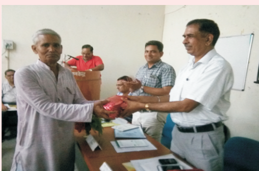
प्रक्षेत्र दिवस के अवसर पर निदेशक प्रसार शिक्षा