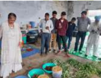
प्राकृतिक खेती प्रशिक्षण में प्रशिक्षणार्थी

समेटी-उत्तराखण्ड द्वारा इस अवधि में कुल 05 प्रशिक्षण क्रमशः उन्नत खारी फसलोत्पादन तकनीक, आय वृद्धि हेतु कुक्कुट पालन, उन्नत बकरी पालन, उन्नत पशुपालन एवं दुधारु पशुओं का प्रबन्धन एवं प्राकृतिक खेती सम्बन्धी प्रशिक्षण आयोजित कराये गये। इन कार्यक्रमों में कुल 147 मशरूम उत्पादक, उद्यान निरीक्षक, फार्म स्कूल संचालक, नर्सरी पालक, विभागीय अधिकारी एवं प्रगतिशील कृषक प्रतिभाग किये।