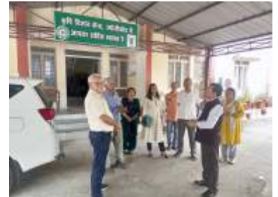
मा. कुलपति जी का केन्द्र पर भ्रमण