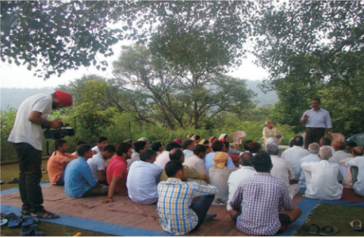
प्रशिक्षण के दौरान कृषकों को जानकारी देते हुए वैज्ञानिक

लाभान्वित किया गया। इस के अतिरिक्त खारी फसल उत्पादन, सब्जी