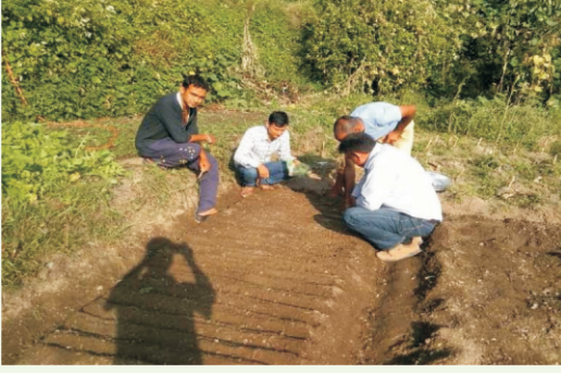
सब्जी पौध उत्पादन पर प्रशिक्षण