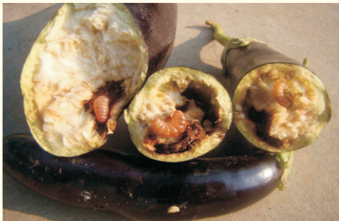
बैंगन छेदक कीट

गया। टमाटर के प्रदर्शन में फल छेदक कीट एवं बैंगन के शाख एवं फल छेदक कीट के प्रबन्धन हेतु कोराजेन कीटनाशक की एक मिली. मात्रा तीन लीटर पानी में घोल बनाकर 15 दिनों के अन्तराल पर तीन छिड़काव से इस कीट का प्रबन्धन हो गया। टमाटर की फसल में पछेती झुलसा के प्रबन्धन हेतु करजेट फफूंदनाशक की दो ग्राम मात्रा प्रति लीटर पानी में घोल बनाकर आवश्यकतानुसार छिड़काव करने से इस बीमारी के प्रबन्धन में सफलता मिली।