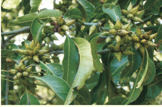
आम में घुण्डी कीट का प्रकोप

के प्रबन्धन विषय पर प्रशिक्षण दिया गया। इन प्रशिक्षणों का आयोजन अगस्त माह में केन्द्र द्वारा आम में घुण्डी कीट