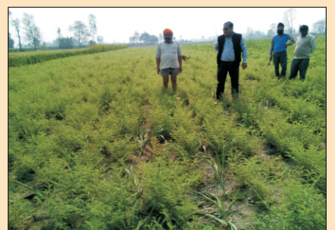
कृषि विज्ञान केंद्रों द्वारा आयोजित प्रशिक्षण, प्रदर्शन एवं भ्रमण कार्यक्रमों की झलकियाँ