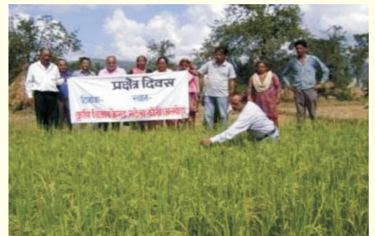
प्रक्षेत्र दिवस का आयोजन

समस्याओं का मौके पर ही निदान भी किया गया साथ ही केन्द्र के वैज्ञानिकों द्वारा अंगीकृत ग्रामों में 04 डायग्नोस्टिक भ्रमण कर