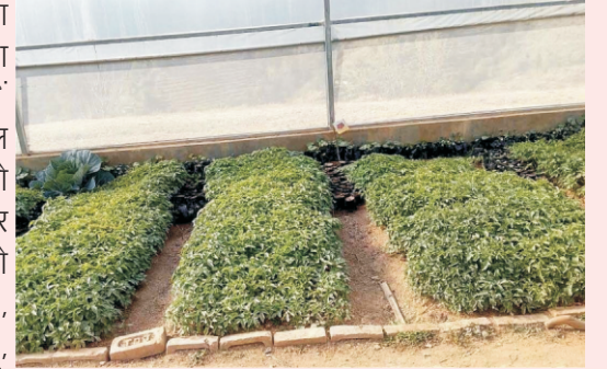
पॉलीहाउस में सब्जी पौध उत्पादन