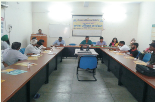
प्रशिक्षण कार्यक्रम का आयोजन

विज्ञान की नवीनतम तकनीकियों पर 4.7 है। कृषक प्रक्षेत्र पर 51 अग्रिम पंक्ति प्रदर्शन लगाए गए। साथ ही 15 कृषक प्रक्षेत्रों पर मत्स्य सम्बन्धित एवं पौष्टिक आटे के द्वारा महिलाओं के पोषण स्तर में सुधार हेतु कृषक प्रक्षेत्र पर परीक्षण आयोजित किये गये।