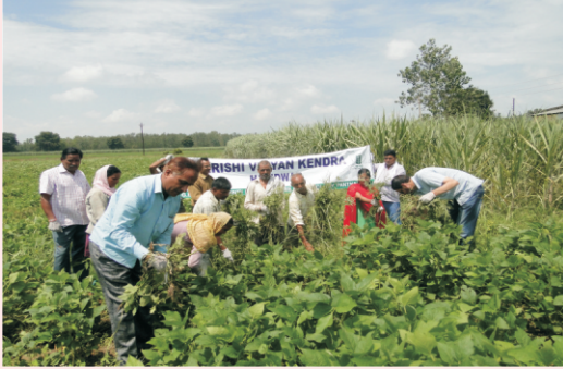
गाजर घास उन्मूलन सप्ताह का आयोजन