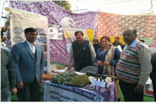
किसान मेला एवं कृषक गोष्ठी का आयोजन