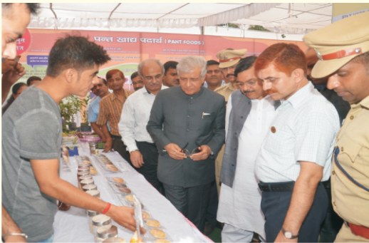
स्टॉल का निरीक्षण करते हुए मा. राज्यपाल

मेले में विश्वविद्यालय के विभिन्न महाविद्यालयों के साथ-साथ राष्ट्रीय एवं अन्तर्राष्ट्रीय स्तर के फर्मों ने स्टॉल लगाकर कृषि से सम्बन्धित उत्पादों एवं तकनीकों का प्रदर्शन किया। मेले में अनुसंधान केन्द्रों पर परीक्षणों/प्रदर्शनों का अवलोकन, रबी की फसलों के नवीनतम प्रजातियों के बीज व मिनीकित की बिक्री, शाक-भाजी एवं फलों के उन्नत बीजों व पौधों की