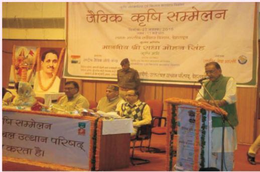
जैविक कृषि सम्मेलन को सम्बोधित करते हुए मा. कृषि मंत्री श्री राधा मोहन सिंह

530 कृषक एवं कृषक महिलाओं ने प्रतिभाग किया। इस अवसर पर मुख्य अतिथि, मा. कृषि एवं किसान कल्याण मंत्री, भारत सरकार, श्री राधा मोहन सिंह ने कृषि के बदलते परिवेश में रसायनों का प्रयोग कम करते हुए जैविक खेती को प्रोत्साहन देने की बात कही। उन्होंने प्रदेश में सिंचाई के अर्न्तगत क्षेत्रफल बढ़ाने के लिए प्रधानमंत्री कृषि सिंचाई योजना का अधिक से अधिक लाभ लेने का किसानों का आवाहन किया।