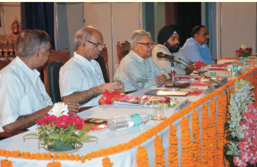
समापन समारोह को सम्बोधित करते हुए मा. मुख्य अतिथि