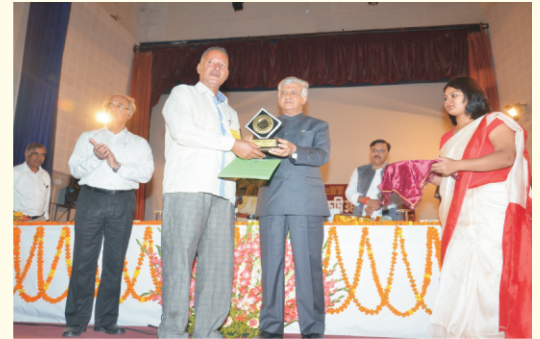
प्रगतिशील कृषक को सम्मानित करते हुए मा. राज्यपाल