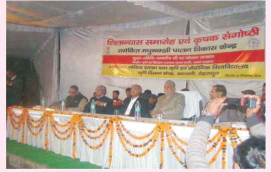
संगोष्ठी के दौरान मा. कृषि राज्य मंत्री श्री पुरषोत्तम रूपाला

पुरषोत्तम रूपाला द्वारा समेकित मधुमक्खी पालन विकास केन्द्र का शिलान्यास किया गया। इस अवसर पर पन्तनगर विश्वविद्यालय के कुलपति