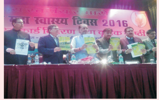
विश्व मृदा स्वास्थ्य दिवस का आयोजन

केन्द्र के तत्वाधान में दिसम्बर 05, 2016 को 'विश्व मृदा स्वास्थ्य दिवस' का आयोजन किया गया। इस अवसर पर मा. केन्द्रीय कृषि