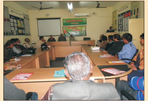
कृषि विज्ञान केंद्रों द्वारा आयोजित प्रशिक्षण, प्रदर्शन एवं भ्रमण कार्यक्रमों की झलकियाँ