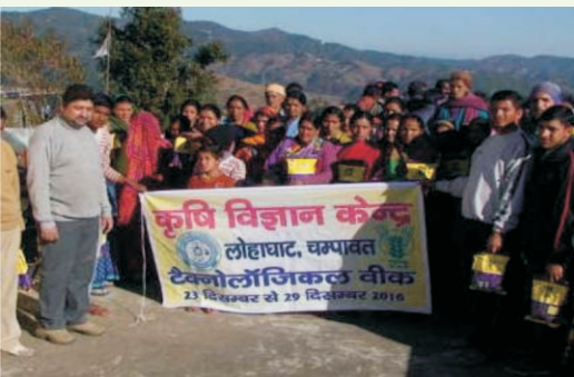
तकनीकी सप्ताह में प्रतिभाग करते हुए कृषक

चम्पावत का भ्रमण कराया गया। तकनीकी सप्ताह में कुल 95 पुरुष एवं 132 महिलाओं सहित कुल 227 कृषकों ने प्रतिभाग कर कृषि तकनीकी जानकारी प्राप्त की।