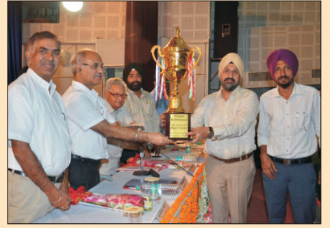
100वाँ अखिल भारतीय किसान मेला एवं कृषि प्रदर्शनी की झलकियाँ