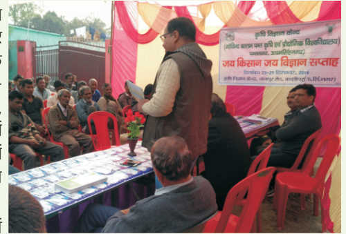
तकनीकी सप्ताह में सम्बोधित करते हुए वैज्ञानिक