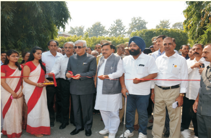
किसान मेले का उद्घाटन करते हुए मा. राज्यपाल उत्तराखण्ड, डा. के.के. पॉल

प्रसार शिक्षा निदेशालय के तत्वाधान में 'कृषि कुंभ' के नाम से विख्यात 100वाँ अखिल भारतीय किसान मेला एवं कृषि उद्योग प्रदर्शनी का भव्य आयोजन