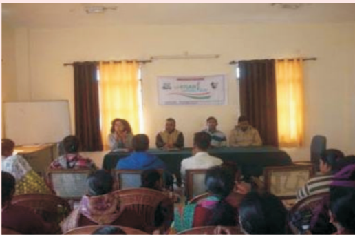
जय किसान जय विज्ञान दिवस के अवसर पर कृषक गोष्ठी