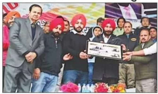
पंतनगर में प्रतियोगिता का शुभारंभ करते अतिथि। संवाद